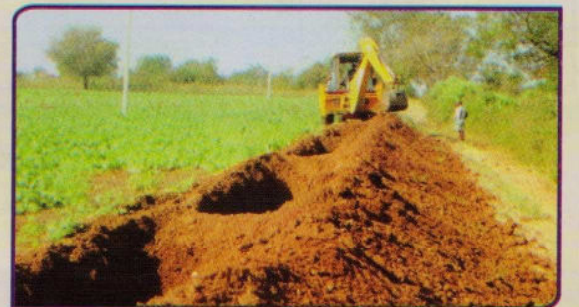
Trench Cum Bund