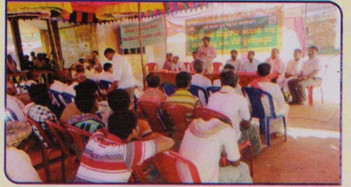
ದಿನಾಂಕ 8-1-2013 ಕಣಿವೆಹಳ್ಳಿ, ಹರಪನಹಳ್ಳಿ ತಾಲ್ಲೂಕು.