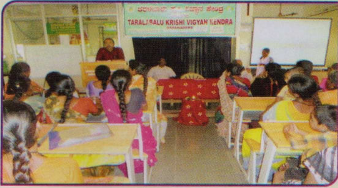
ದಿನಾಂಕ 8-3-2013 'ಅಂತರರಾಷ್ಟ್ರೀಯ ಮಹಿಳಾ ದಿನಾಚರಣೆ'.