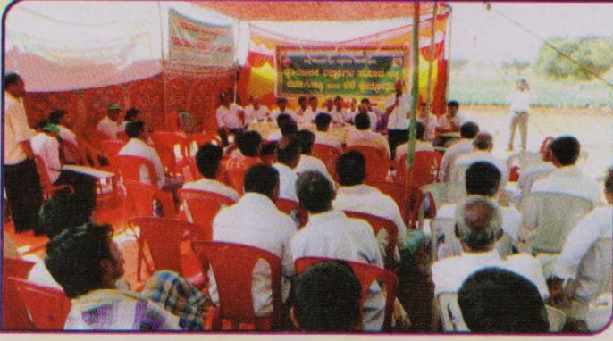
ದಿನಾಂಕ 7-01-2013 ಅಣಜಿಗರೆ, ಹರಪನಹಳ್ಳಿ ತಾಲ್ಲೂಕು.