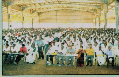
ಸಿರಿ ಹಬ್ಬದಲ್ಲಿ ನೆರೆದಿರುವ ಅಪಾರ ಜನಸಂಖ್ಯೆ