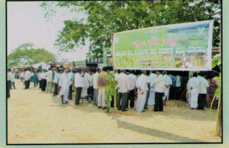
ಸಾವಯವ ವಸ್ತು ಪ್ರದರ್ಶನ ಮಳಿಗೆಗಳಿಗೆ ರೈತರ ಬೇಟೆ

ಸಿರಿಗೆರೆಯಲ್ಲಿ ನಡೆದ 'ರೈತ ಸಿರಿ ಹಬ್ಬ' ದಲ್ಲಿ ಪರಮ ಪೂಜ್ಯ ಜಗದ್ಗುರುಗಳವರು ನೆರೆದ ಸಮಸ್ತ ರೈತ ಬಾಂಧವರಿಗೆ ಗ್ರಾಮದಲ್ಲಿ ಆಹಾರ ಬೆಳೆಗಳ ಸಂಸ್ಕರಣೆಯನ್ನು ರಸ್ತೆಯಲ್ಲಿ ಮಾಡದೇ ಸುಸಜ್ಜಿತ ಕಣಗಳಲ್ಲಿ ಮಾಡಬೇಕು ಎಂದು ಹೇಳಿದರು. ಪ್ರತಿ ಗ್ರಾಮ ಪಂಚಾಯತ್‌ಗೆ ಒಂದು ಸಾಮೂಹಿಕ ಕಣವನ್ನು ಮಾಡಬೇಕು ಅದರಲ್ಲಿ ನಾವು ಒಕ್ಕಣೆ ಮಾಡಿದರೆ ಗುಣಮಟ್ಟವನ್ನು ಕಾಪಾಡಿಕೊಳ್ಳಲು ಸಾಧ್ಯವೆಂದರು. ತರಳಬಾಳು ಕೃಷಿ ವಿಜ್ಞಾನ ಕೇಂದ್ರವು ಸಾಮಾಜಿಕ ಕಣ ನಿರ್ಮಾಣ ಯೋಜನೆಗೆ ಕೃಷಿ ಇಲಾಖೆಗೆ ಹಾಗೂ ರೈತರಿಗೂ ಮಧ್ಯಸ್ಥಿಕವಹಿಸಲಿದ್ದು ಆಸಕ್ತರು ಕೇಂದ್ರವನ್ನು ಸಂಪರ್ಕಿಸಿ ಅರ್ಜಿಯನ್ನು ನೀಡಬಹುದೆಂದರು.